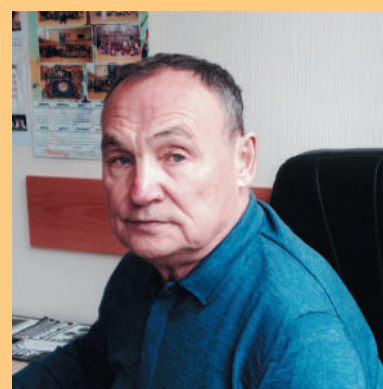
Официальный отдел. Итоги и планы. Студенты, играйте в баскетбол! Стр. 2-3