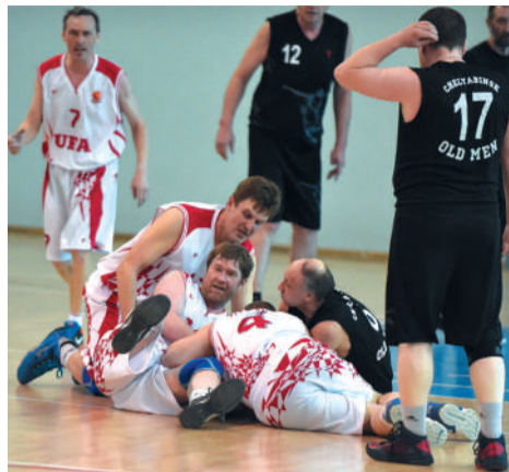
Куча мала. А где же мяч?

Во втором матче турнира «Казань» победила челябинскую команду под броским названием Old Men, хотя на старых мужчин многие ее игроки не очень тянули. На следующее утро в матче за бронзу с Уфой они выглядели вообще вяловато, играли без огонька на фоне бодрых башкирских ветеранов и потерпели поражение – 52:70.