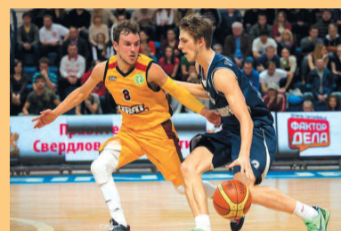
Трудный сезон «Урала». Стр. 5