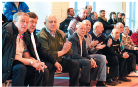
Баскетбол им всегда интересен