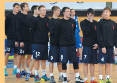
УрФУ – окно в Европу. Стр. 8

Цель этого номера газеты – рассказать любителям спорта о наиболее, на наш взгляд, интересных и знаковых событиях прошедшего сезона (в основном областного масштаба), поделиться планами баскетболистов на предстоящий сезон.