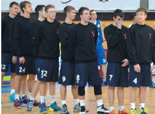
Таллинского технического университета (Эстония), Московского государственного уни-

В турнире выступали, кроме УрФУ, команды университета из Дебрецена (Венгрия),