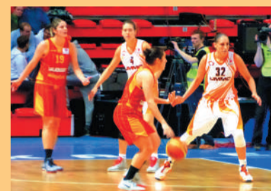
УГМК. Радости и огорчения. Стр. 4