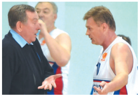
Диалог в паузе. Тренер и капитан

На трибуны в основном пришли уже солидного возраста люди, седовласые ветераны. Они собрались вместе не только для того, чтобы посмотреть на игру своих давних друзей и