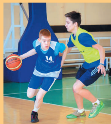
Школьный спорт. Акции УГМК. «КЭС-Баскет» Стр. 9