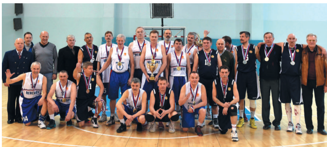
Участники финального матча ветеранов Екатеринбурга и Казани