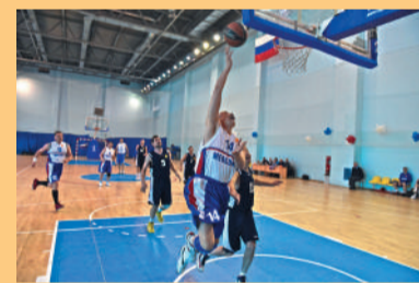
Ветераны в строю. Победы в домашних стенах и за рубежом. Стр. 6-7

Вообще-то, календарный год у баскетбольных команд почти всех уровней длится с осени до конца мая. Однако и в межсезонье в баскетбольной жизни не наступает штиль. Дети, юные игроки по-прежнему охотно проводят свой досуг на дворовых и школьных площадках, в оздоровительных и спортивных лагерях. А совсем недавно, в августовские дни, жители Екатеринбурга и ряда других городов области с удовольствием смотрели соревнования по стритболу (уличному баскетболу), который проходил прямо на городских площадях. В них приняли участие тысячи людей самых разных возрастов и профессий.